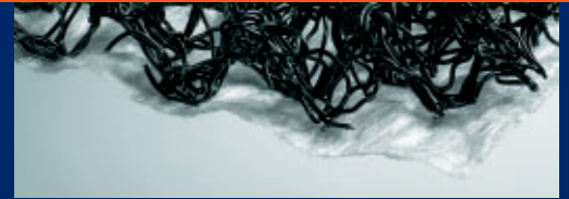
TenCate Polyfelt Megadrain